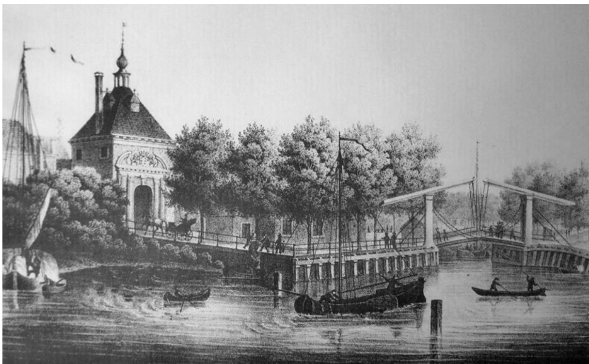
Rotterdamse Poort en Mallegatsluis